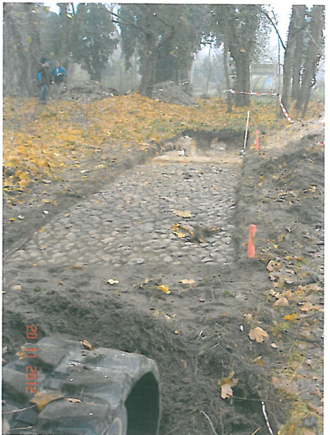
KLM-BP-007 „Altes Dorf“, Archäologische Sondierung, Grabungsfotos