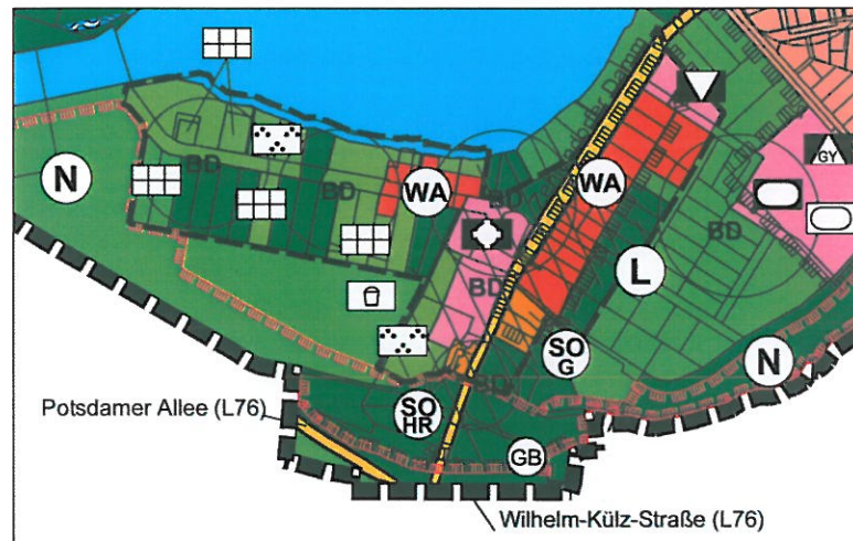
Vorentwurf 14. Änderung (Maßstab 1 : 10.000)